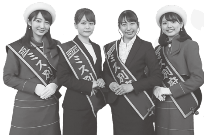
ミス別府の皆さん