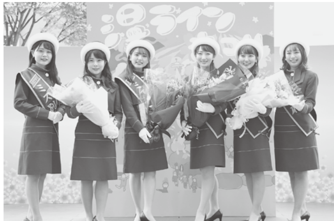
ミス別府の皆さん

別府市が大好きな方、 自薦・他薦は問いません。 一緒に別府を盛り上げてくれませんか？ たくさんのご応募をお待ちしております。